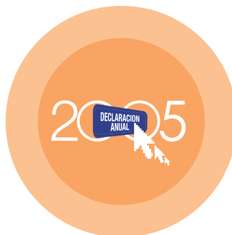
1 tinta azul cv2756